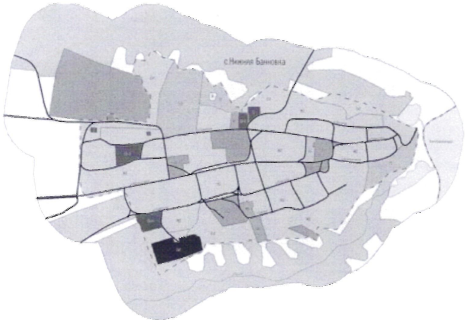
Пример застройки и устройства Невнобановского муниципального образования Красноармейского муниципального района Саратовской области "Коды градостроительного зонирования"