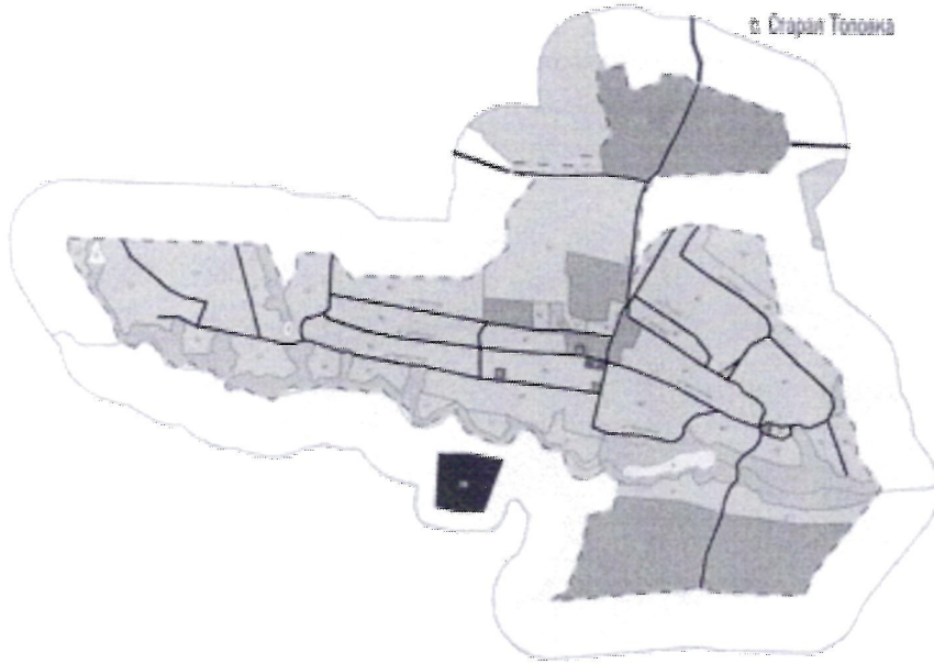
КАРТА ГРАНИЦ ЗОН С ОБЪЕДАМИ КОМПЛЕКСНОГО ИСПОЛЬЗОВАНИЯ ТЕРРИТОРИИ